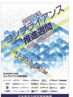
「コンプライアンス推進週間」ポスター (国立研究開発法人協議会における統一活動)