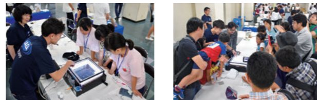
「青少年のための科学の祭典」の様子

原子力機構は、外部展示イベントへの出展を積極的に行っています。毎年、夏に開催される「青少年のための科学の祭典」では、小中学生を対象とした科学の実験教室を行っており、これまでミネラルウォーターの水質調査や、霧箱を使用した身近な放射線の観察等を実施しました。アジア最大級の分析・科学機器専門展示会イベント「JASIS2018」では、高感度ガス分析装置のデモ展示やプレゼンテーション等を行いました。