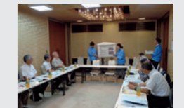
さいくろミーティング