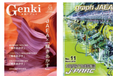
広報誌「未来へげんき」 Web版広報誌「graph JAEA」

また、研究者や技術者が自らの研究開発成果を発信する短編動画「Project JAEA」の配信や原子力機構のさまざまな研究開発の取組を分かりやすく紹介する広報誌「未来へげんき」を発行しています。加えて、見応えのある写真を中心としたWeb版広報誌「graph JAEA」等をホームページに掲載するとともに、活動内容をソーシャル・ネットワーキング・サービス(SNS：公式Twitterアカウント／@JAEA_japan)で紹介することで、広く情報発信を行っています。