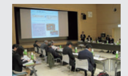
ウランと環境研究懇話会

原子力機構では、広報活動が情報の受け手のニーズを反映したものとなるように、リスクコミュニケーションの手法を取り入れています。リスクコミュニケーションとは、対象がもつ利点だけでなく欠点も開示した上で関係者が語り合い、関係者間の信頼構築を図るものです。「情報公開」「双方向」「共考」という3つの段階に分けられ、第3段階の「共考」に取り組んでいるものは、東海地区で行っている「地域住民懇談会」、人形峠環境技術センターでの「ウランと環境研究懇話会」や敦賀地区での「地域モニター制度」ですが、2018年度からは、広報部と安全・核セキュリティ統括部とで連携し、これらの拠点訪問を行い、状況把握や課題共有を図り、更なる改善に向けての意見交換を実施しました。