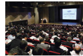
原子力機構報告会

機構全体の報告として年に1度「原子力機構報告会」を開催しているほか、「福島研究開発部門成果報告会」や「むつ海洋・環境科学シンポジウム」「EReTTSa(エレッサ)シンポジウム」「OECD/NEA主催クリスタリンクラブ会議」「廃止措置技術の展開に係る技術交流会」等、研究拠点や研究テーマごとに報告会やシンポジウムを行っています。