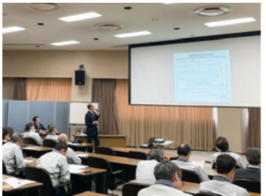
組織連携研修 (敦賀事業本部におけるコンプライアンス研修会)

また、国立研究開発法人協議会コンプライアンス専門部会の活動に参加し、コンプライアンス意識の啓発を図りました。