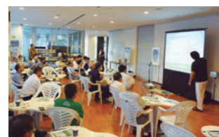
サイエンスカフェ

研究者・技術者と一般の方々気軽に科学について直接語り合える相互コミュニケーションの場として、サイエンスカフェを定期的に開催しています。