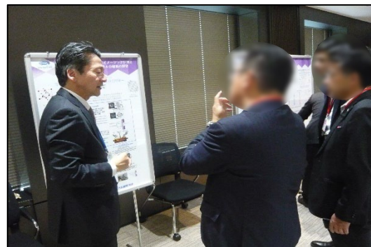
ポスター展示説明③