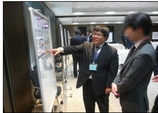
ポスター展示説明①