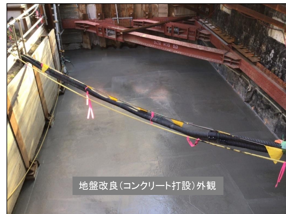
地盤改良工事の状況 (令和3年12月)

※埋土部分を約6 m (T.P. 約0 m) まで掘削し、高さT.P.+4 mまでコンクリートに置換する。