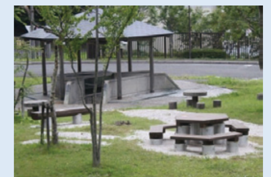
東屋の水槽の中にいます