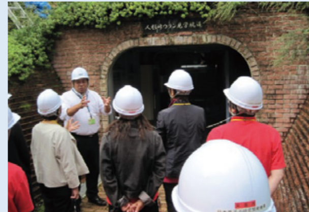
見学坑道前での説明の様子 (1950年代に掘削した坑道です)