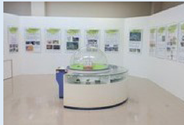
教育棟展示スペースの状況 (ご自由に見学できます)