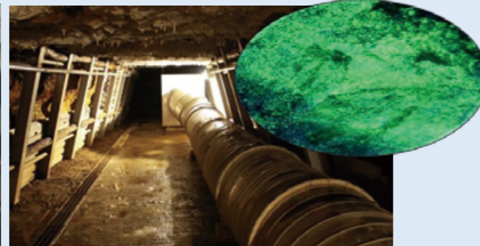
見学坑道の内部 (右上は発色したウラン鉱床)