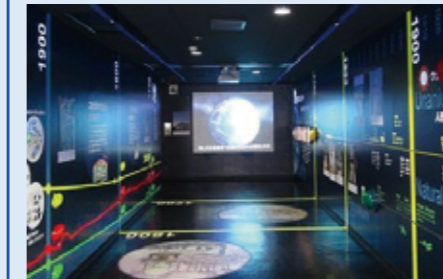
岡山県アトムサイエンス館

人形峠環境技術センターの教育棟に隣接する「岡山県アトムサイエンス館」と「JAXA**上齋原スペースガードセンター展示室」の見学もできます