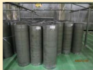
【ウラン濃縮原型プラント】