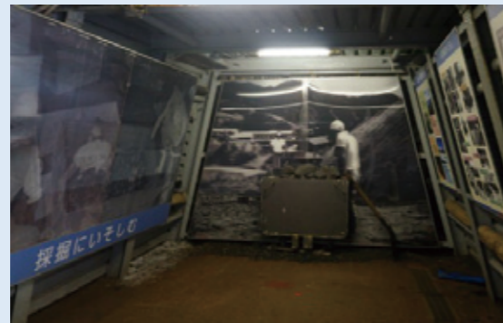
探鉱当時を再現したパネル展示