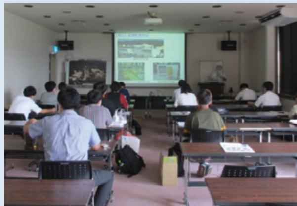
会議室での概況説明 (人形峠の歴史と近況をご説明します)

教育棟会議室において人形峠環境技術センターの概況をお聞きいただいた後、バスにより構内を一巡するとともに見学坑道*をご覧いただくことができます。