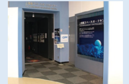
上齋原スペースガードセンター 展示室入口