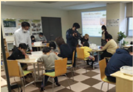
幼児～小学校低学年のお子さんを対象とした、「人形峠サテライトオフィスふらっと」での工作活動の様子（毎月第4日曜日に開催中）