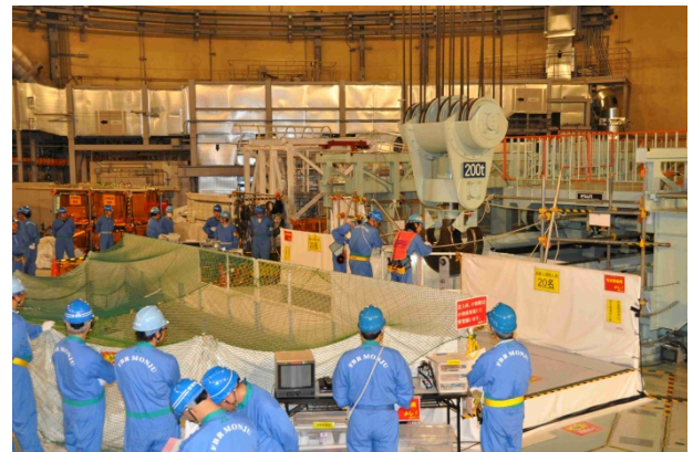
平成23年 6月23日 16時50分頃の作業風景

黒字：本設機器を示す 青字：本設機器の内、取外し・取付け作業を実施するものを示す 赤字：仮設機器・治具類を示す