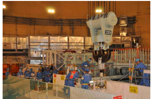
平成23年 6月23日 21時30分頃の作業風景

黒字：本設機器を示す 青字：本設機器の内、取外し・取付け作業を実施するものを示す 赤字：仮設機器・治具類を示す