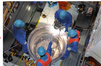
平成23年 6月20日 15時頃の作業風景