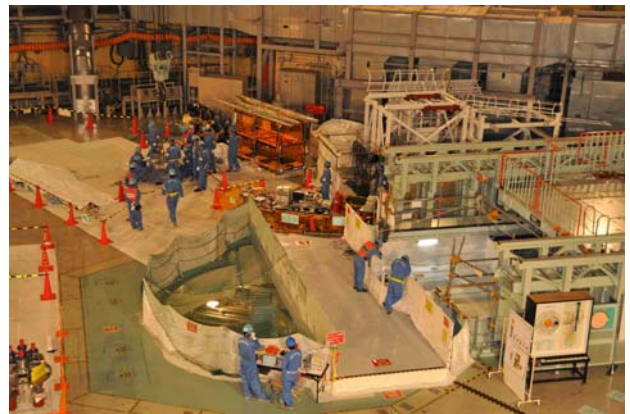
平成23年 6月13日 14時頃の作業風景