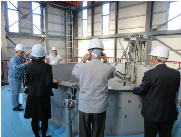
鯖江商工会議所建設業部会様