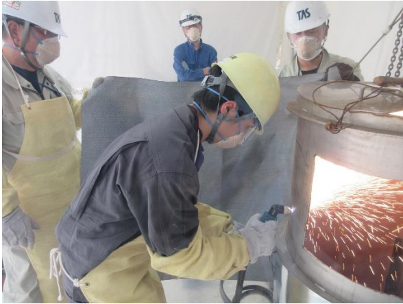
敦賀商工会議所様 (エネルギー産業起業化研究会)