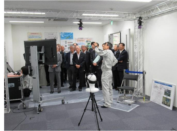
福井県商工会議所連合会様