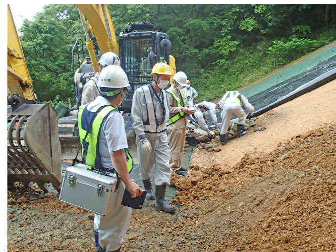
掘削土の確認（岐阜県、瑞浪市、土岐市）