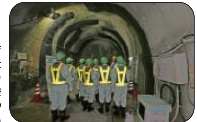
施設見学会(深度300mステージ)

工事現場での安全の確保のため、小学生の方は4年生以上で保護者同伴でお願いします。また入坑の際は、安全装備(つなぎ服・反射ベスト・ヘルメット・安全長靴・軍手・坑内PHSなど)を着用して頂きます。工事現場ですので、狭くて急な階段等もあります。階段の昇降等が困難な方など自立歩行に支障のある方や高所、閉所恐怖症の方などは研究坑道に入坑できない場合がありますので、事前にご確認をお願いいたします。