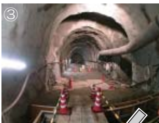
深度500m 研究アクセス北坑道