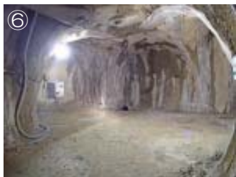
深度500m 研究アクセス南坑道