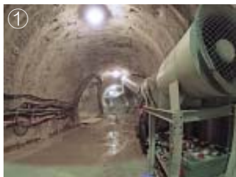
深度500m予備ステージ