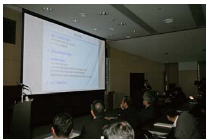
情報・意見交換会の会場

当日は、全国の大学や研究機関、企業、一般の方を含めて約130名（機構関係者含む）が参加し、有意義な意見交換が行われました。