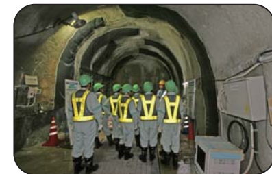
施設見学会(深度300mステージ)

工事現場での安全の確保のため、小学生の方は4年生以上で保護者同伴でお願いします。また入坑の際は、安全装備(つなぎ服・反射ベスト・ヘルメット・安全長靴・軍手・坑内PHSなど)を着用して頂きます。工事現場での現場ですので、狭くて急な階段等もあります。階段の昇降等が困難な方など自立歩行に支障のある方や高所、閉所恐怖症の方などは研究坑道に入坑できない場合がありますので、事前にご確認をお願いいたします。