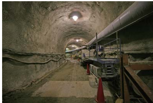
深度500m研究アクセス北坑道

※坑道の位置や長さなどは計画であり、研究ニーズ、地質環境や施工条件などにより、決定していきます。