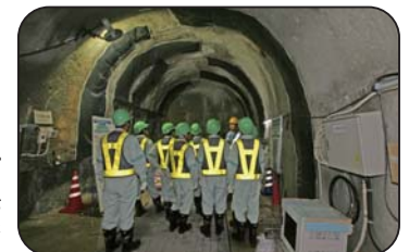
施設見学会(深度300mステージ)

◆氏名等の個人情報は、当機構主催の見学会や講演会等のご案内に使用させていただく場合があります。