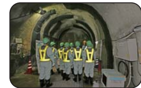
施設見学会（深さ300m研究アクセス坑道）

（工事現場での安全の確保のため、小学生の方は4年生以上で保護者同伴をお願いします。また入坑の際は、安全装備（つなぎ服・反射ベスト・ヘルメット・安全靴・手袋・坑内PHSなど）を着用して頂きます。工事現場ですので、狭く急な階段等もあります。階段の昇降等が困難な方など自立歩行に支障のある方や高所、閉所恐怖症の方などは研究坑道に入坑できない場合がありますので、事前にご確認をお願いいたします。