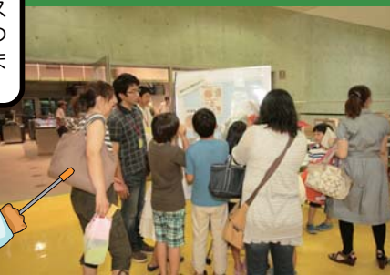
3Dメガネを用いて地形を立体的にみている様子

岐阜県先端科学技術体験センター（サイエンスワールド）で、子供たちを対象とした科学イベント「サイエンスフェア」が開催されました。