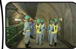
施設見学会 (深度300m研究アクセス坑道)

工事現場での安全の確保のため、小学生の方は4年生以上で保護者同伴でお願いします。また入坑の際は、安全装備（つなぎ服・反射ベスト・ヘルメット・安全長靴・軍手・坑内PHSなど）を着用して頂きます。工事現場ですので、狭くて急な階段等もあります。階段の昇降等が困難な方など自立歩行に支障のある方や高所、閉所恐怖症の方などは研究坑道に入坑できない場合がありますので、事前にご確認をお願いいたします。