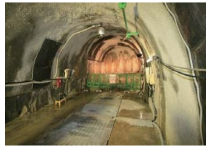
深度300mボーリング横坑（換気立坑）

瑞浪超深地層研究所の施設見学会を参加希望の方は、事前申し込み（原則1週間前まで）が必要となりますので、住所、氏名、電話番号を下記の連絡先までお知らせください。また、来月の施設見学会の案内につきましては裏面をご参照ください。