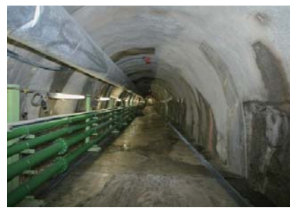
深度300m研究アクセス坑道

坑内PHS 緊急時の通報や避難誘導の連絡用、坑道内のどの場所にいるか位置検索に使用