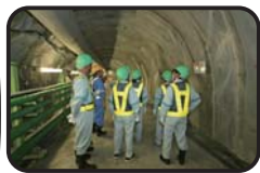
施設見学会 (深度300m研究アクセス坑道)

工事現場での安全の確保のため、小学生の方は4年生以上で保護者同伴でお願いします。また入坑の際は、安全装備(つなぎ服・反射ベスト・ヘルメット・安全長靴・軍手・坑内PHSなど)を着用して頂きます。工事現場ですので、狭くて急な階段等もあります。階段の昇降等が困難な方など自立歩行に支障のある方や高所、閉所恐怖症の方などは研究坑道に入坑できない場合がありますので、事前にご確認をお願いいたします。