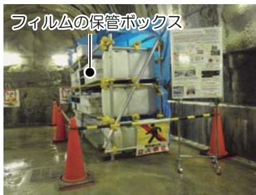
深度200mボーリング横坑（主立坑）に保管されたフィルム