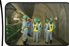
施設見学会 (深度300m研究アクセス坑道)

工事現場での安全の確保のため、小学生の方は4年生以上で保護者同伴でお願いします。また入坑の際は、安全装備(つなぎ服・反射ベスト・ヘルメット・安全長靴・軍手・坑内PHSなど)を着用して頂きます。工事現場ですので、狭くて急な階段等もあります。階段の昇降等が困難な方など自立歩行に支障のある方や高所、閉所恐怖症の方などは研究坑道に入坑できない場合がありますので、事前にご確認をお願いいたします。