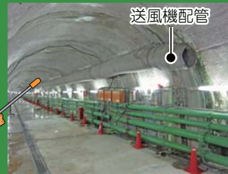
深度300m研究アクセス坑道

「地下300mって涼しいの？」とよく聞かれます。瑞浪超深地層研究所では、坑道内に外の空気を送りこんで換気を行っています。外の空気は季節によって気温が変動するため、外の空気を送りこんでいる坑道内も季節により気温が変動します。瑞浪超深地層研究所の深度300m地点では、年間を通じて21～26度程度の気温となります。また、坑道内は湿度が高い（ほぼ100%）ため蒸し暑く感じます。