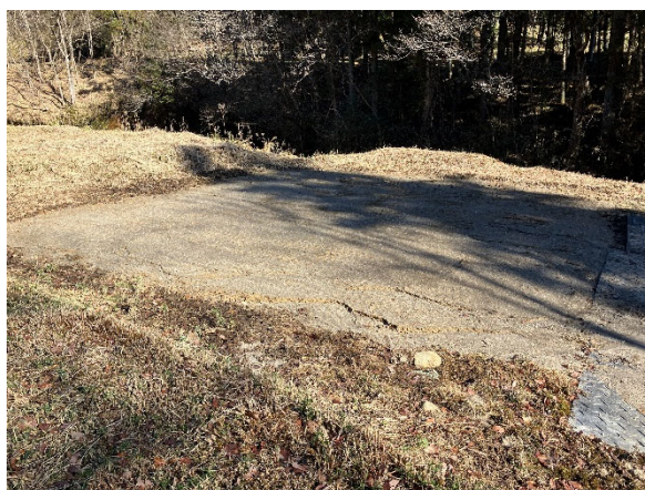
MIU-3 号孔の例(左:閉塞前(環境モニタリング)の様子、右:閉塞作業完了後)

令和 8 年度から瑞浪用地内の地上部に残された基礎コンクリート等の撤去及び整地工事を実施する予定としています。その際、地盤の掘削により土地の形質が変化することから、土壤汚染対策法に基づき、事前の土壤調査を実施しました。その結果、用地内で調査を行った 119 地点のうち 1 地点でふっ素の土壤溶出量が基準を超えている(基準 0.8mg/L 以下に対して 3.2mg/L を検出:調査検体数 109、基準超過検体数 1)ことが分かりましたので、速やかに自治体(岐阜県、瑞浪市)へ報告しました。この調査結果については、岐阜県のホームページ* 3 で公表されています。