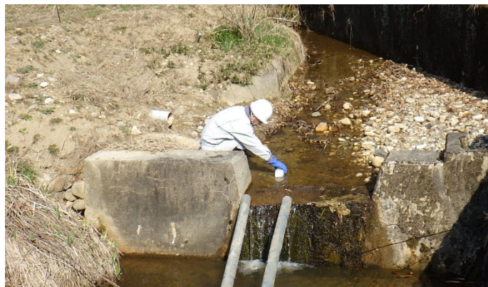
周辺河川水の放射性物質濃度測定用採水作業

放流水・放流先河川水の放射性物質濃度の測定を継続するとともに、定期的な巡視・点検等を行います。