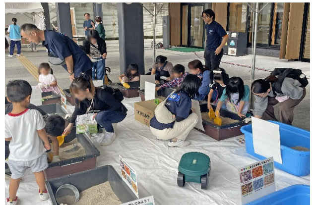
ブック&サイエンスフェス 2025