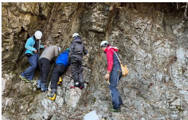
現地における地質調査(長野県)

地形からの特定が困難な活断層等を検出し、活動性や影響範囲を把握するための地質調査の技術開発として、長野県や鳥取県等に存在する断層を事例として、小さな断層に記録されたずれを用いた応力逆解析的手法や地球物理学的情報等を組み合わせた手法の検討を進めました。また、フィッション・トラック自動計測装置 *1 による地質試料の年代測定のほか、レーザーアブレーション付きマルチコレクター誘導結合プラズマ質量分析装置 *2 を使った鉱物中の微小領域での年代測定技術の開発や、加速電圧が5MVの加速器質量分析装置 *3 を用いた塩素-36による年代測定の実用化に向けた技術開発を進めました。なお、研究開発の一部については、経済産業省資源エネルギー庁からの委託研究(令和5年度高レベル放射性廃棄物等の地層処分に関する技術開発事業(JPJ007597)(地質環境長期安定性総合評価技術開発)として実施しました。