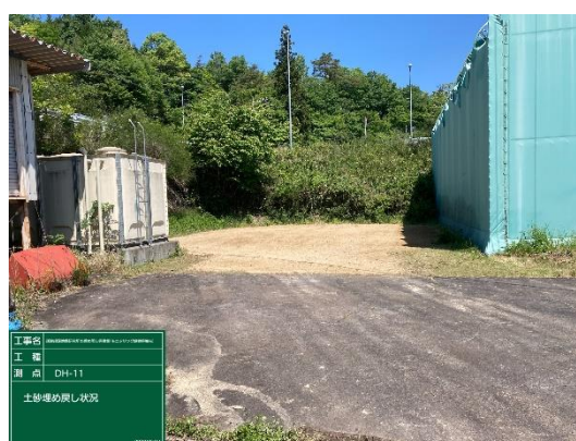
DH-11号孔の閉塞作業(左:作業前、右:作業後)