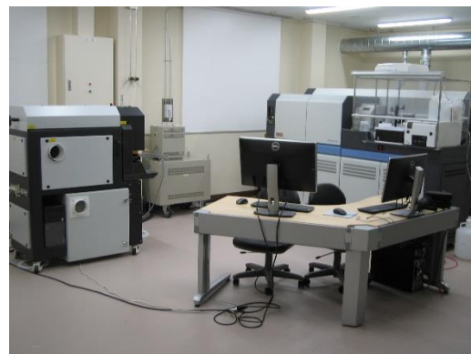
レーザーアブレーション付きマルチコレクター誘導結合プラズマ質量分析装置