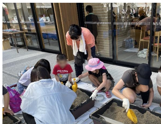
ブック&サイエンスフェス 2023