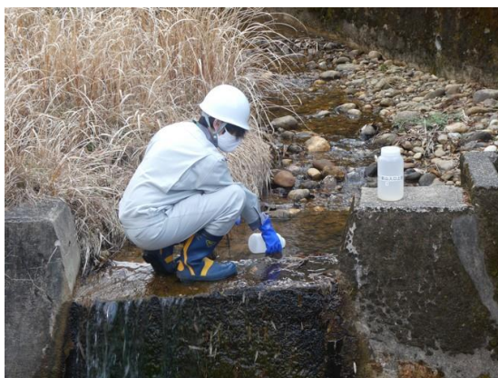
周辺河川水の放射性物質濃度測定用 採水作業

放流水・放流先河川水の放射性物質濃度の測定を継続するとともに、定期的な巡視・点検等を行います。