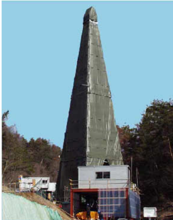
(a) 深層ボーリング孔の掘削現場