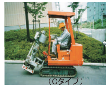
(発震装置)