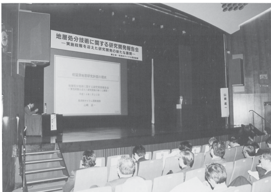
「幌延深地層研究計画の現状」 (山崎幌延深地層研究センターグループリーダー)