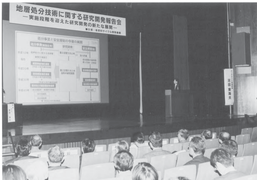
「地層処分技術に関する研究開発の全体計画の概要」 （河田バックエンド推進部長）