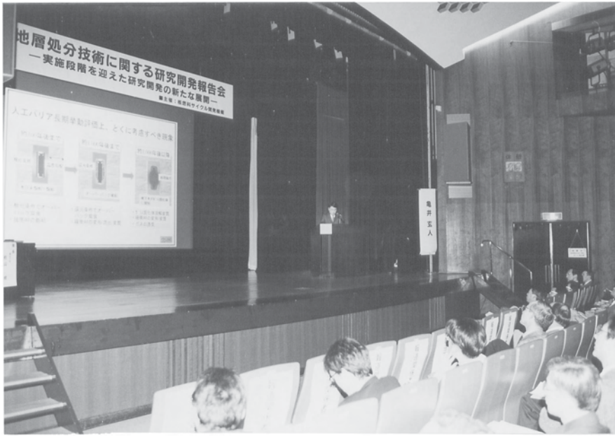
「人工バリアの長期挙動評価の信頼性向上と連成モデルの開発」 (亀井東海処分研究部サブリーダー)