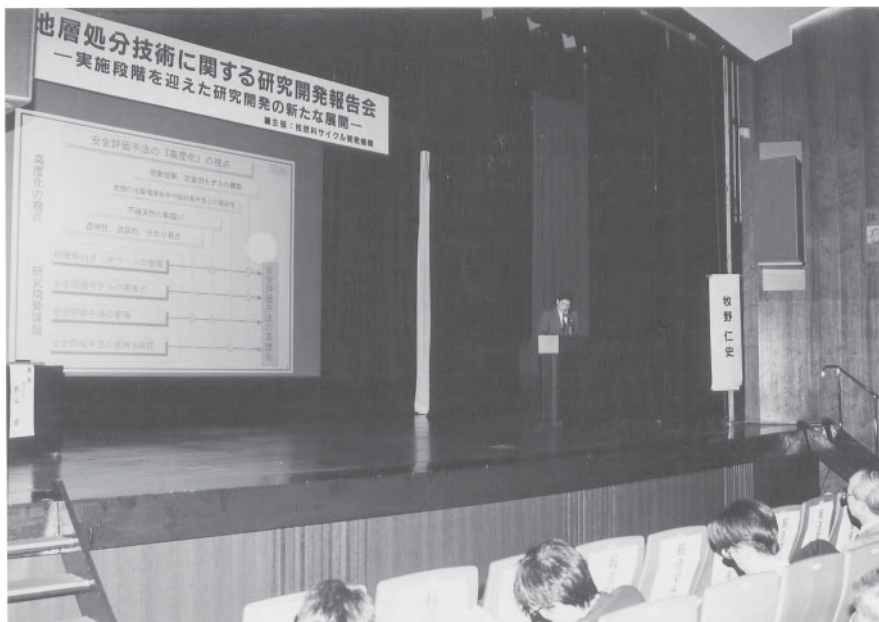
「安全評価手法の高度化に向けた取り組み」 (牧野東海処分研究部副主研)