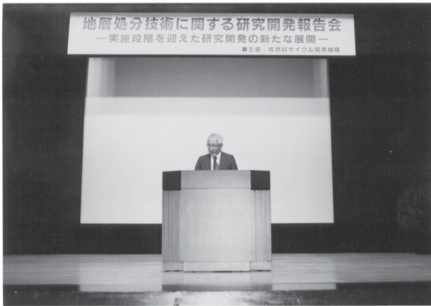
開会挨拶（都甲理事長）