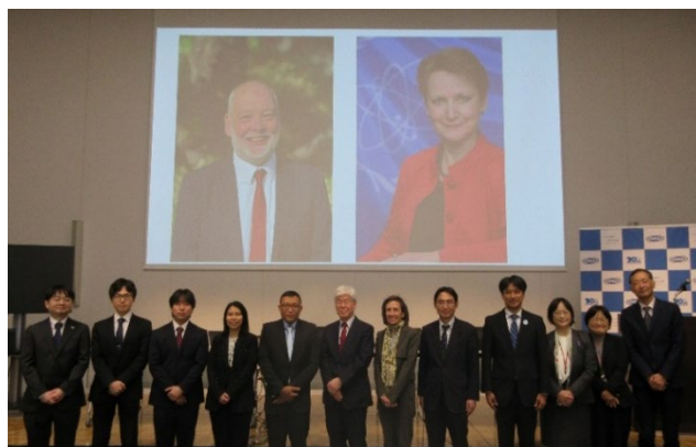
基調講演者やパネリスト等の集合写真

なお、本フォーラムの詳細報告は近々ニューズレター特別号にて掲載予定です。また、基調講演者及びパネリスト等の略歴並びに発表資料等は ISCN ホームページ ( https://www.jaea.go.jp/04/iscn/activity/2025-12-11/index.html )でも掲載しております。