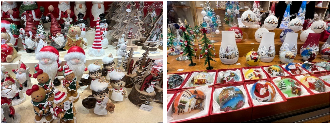
クリスマスにちなんだオーナメントや人形

みなさん、こんにちは。編集委員の関根です。私は JAEA の制度を活用してフランスからフルリモートワークをしています。今回はストラスブールのクリスマスマーケットの雰囲気をお届けします。子どもから大人まで、屋台やホットワインを楽しみながら、クリスマスに向けた飾りや雑貨、お茶やお菓子等、様々なお店を巡り楽しいひと時を過ごしていました。