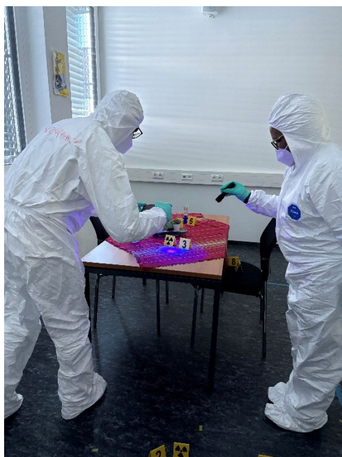
写真 1：模擬容疑者宅での調査の様子