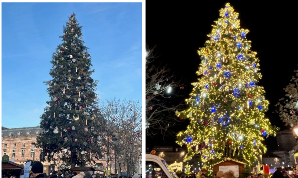
昼と夜、印象が変わるクリスマスツリー