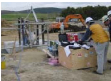
地下水採水作業の例