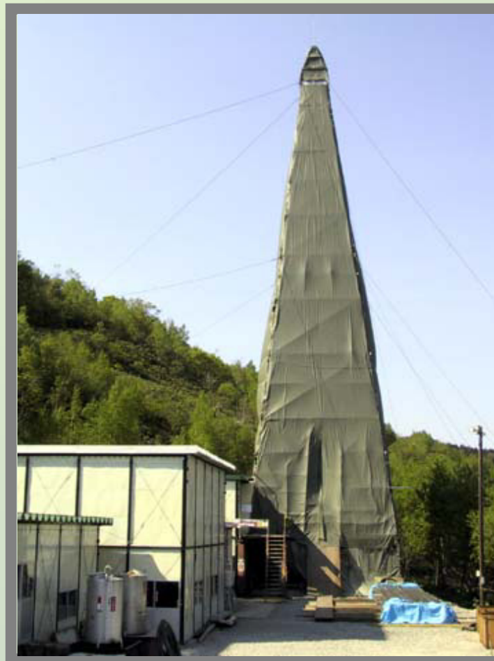
HDB - 2 (B2区域)