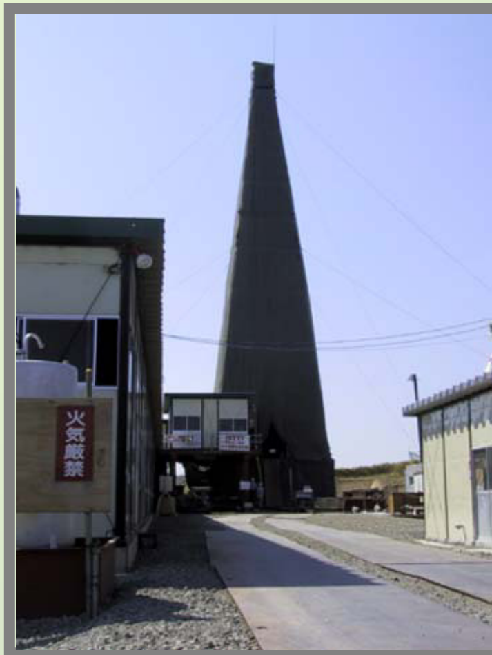
HDB - 1 (B1区域)

平成13年10月より北進地区及び上幌延地区にて試錐調査を実施してまいりましたが、5月25日に試錐孔を用いた試験等の現地調査が終了いたしました。今後は、試錐孔及び孔口の整備を行った後、試錐の櫓撤去や整地等の作業を行います。今後とも幌延深地層研究計画へのご理解ご協力をお願いいたします。