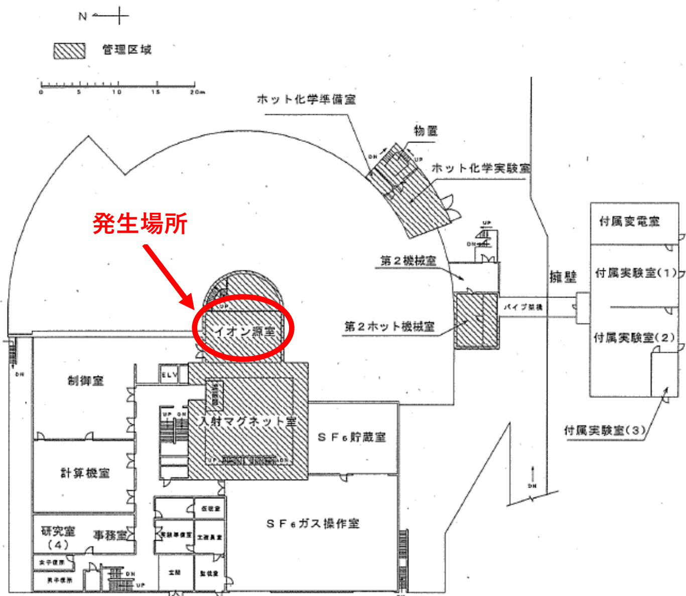
タンデム加速器建家平面図 (1階)