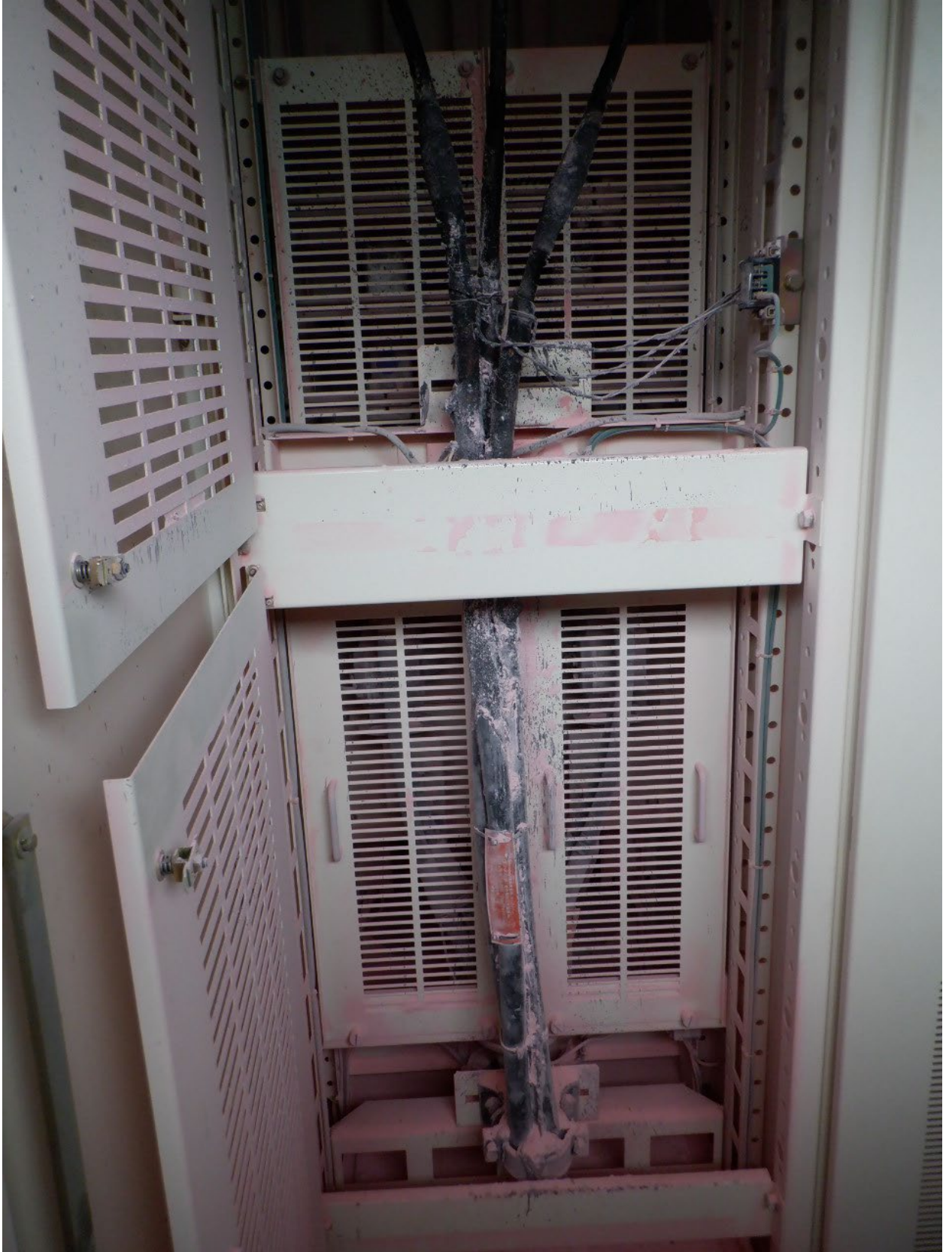
現場写真（高压配電盤）