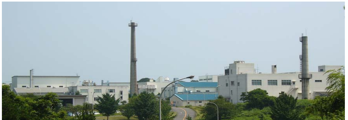
廃棄物管理施設等の全景

平成4年3月に廃棄物管理の事業許可を取得し、改修工事、検査等を経て平成8年3月から事業を開始している。