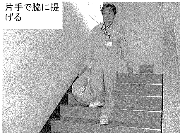
片手で脇に提 げる