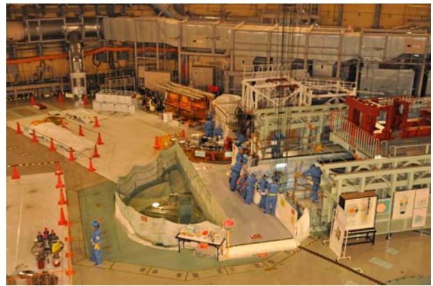
平成23年 6月16日 15時頃の作業風景