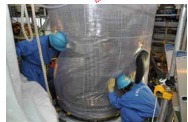
平成23年 6月14日 14時30分頃の作業風景

黒字：本設機器を示す 青字：本設機器の内、取外し・取付け作業を実施するものを示す 赤字：仮設機器・治具類を示す