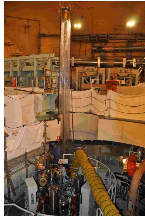
作業風景（平成23年11月16日撮影）