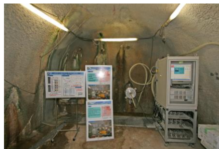
深度 300m 研究アクセス坑道 100m計測坑道