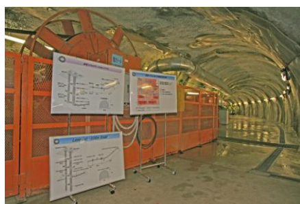
深度 300m 研究アクセス坑道

昨年に引き続き、深度 300m ステージの研究坑道の説明用パネルを適宜更新しています。