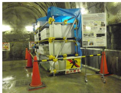
原子核乾板の貯蔵の様子