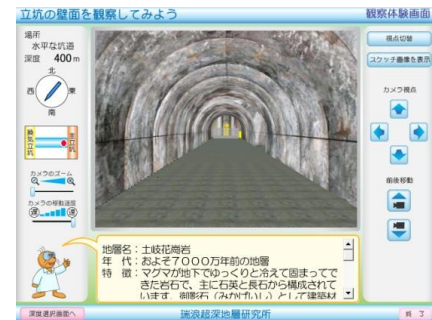
立坑の壁面を観察してみよう！ (体験ソフト)

研究所の地下深くの様子を分かりやすく楽しく学べるコンテンツとして、研究坑道の壁面写真やスケッチを用いた、パソコン上で地層の観察ができる体験ソフトの壁面データの更新を行いました。