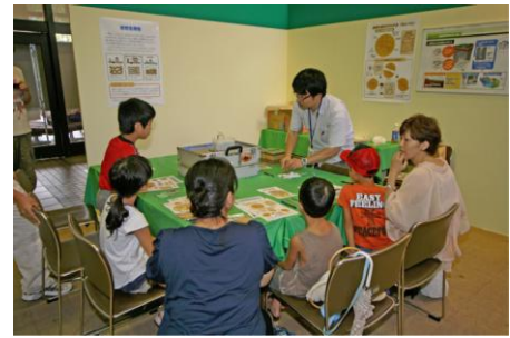
おもしろ科学館 2010in みずなみ