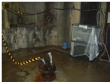
深度 200m ボーリング横坑での地震計

東濃地震科学研究所における研究坑道への地震計・歪計による観測及び名古屋大学におけるニュートリノ捕捉用原子核乾板の貯蔵を行っています。