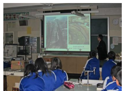
御嵩町共和中学校への講師派遣