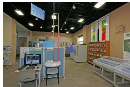
(管理棟展示コーナーの様子)