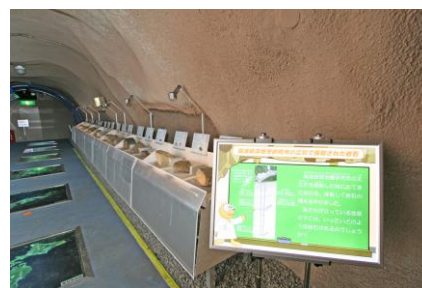
(瑞浪市地球回廊における立坑の岩石展示の様子)