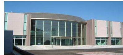
オフサイトセンター