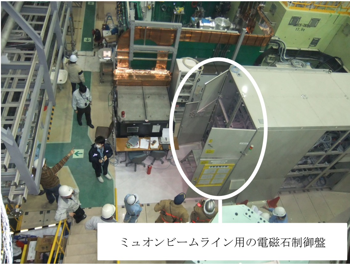
図 3 ミュオンビームライン用の電磁石制御盤