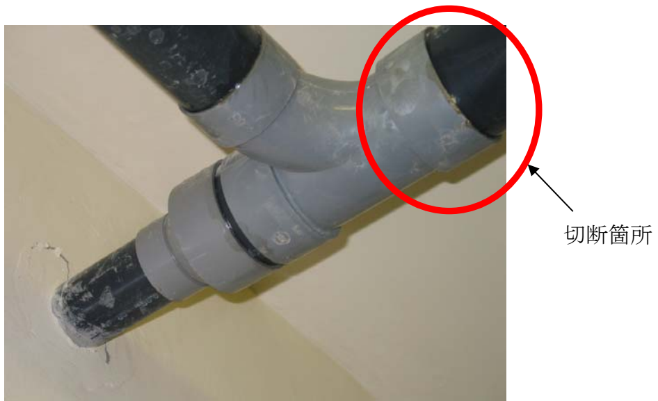
調査対象の継手（運転制御室）