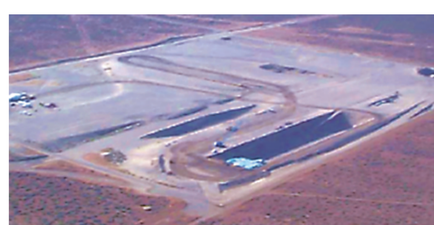
リッチランド(アメリカ) 1965 年～ トレンチ埋設施設