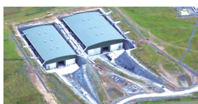
ドーンレイ(イギリス) 2015 年～ ピット埋設施設