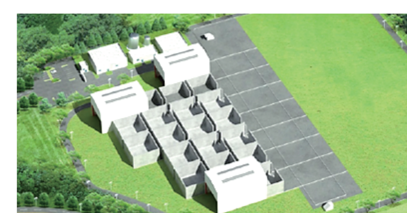
ウォルソン(韓国) 2022 年～建設中 ピット埋設施設 韓国原子力環境公社 (KORAD)