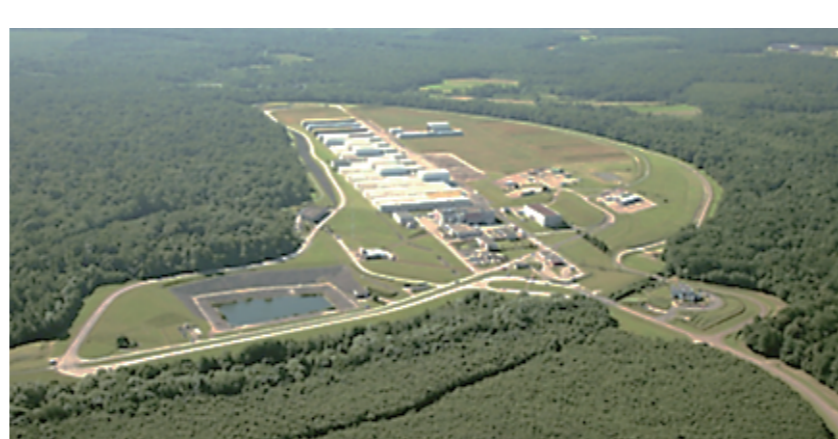
オーブ(フランス) 1992 年～ ピット埋設施設