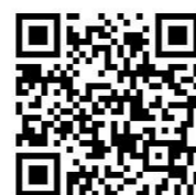
《東濃地科学センターHP》

原子力機構公式 Twitter https://twitter.com/jaea_japan