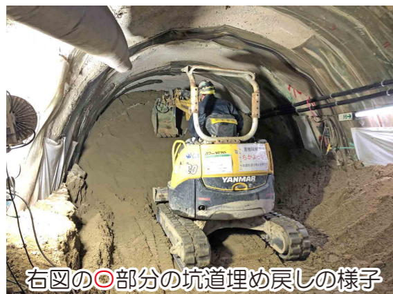
右図の◎部分の坑道埋め戻しの様子

埋め戻し作業にあたっては、引き続き地元自治体との協定を遵守するとともに、積極的な情報公開、安全確保を第一に進めて参ります。