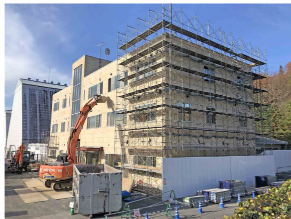
解体用の足場設置の様子