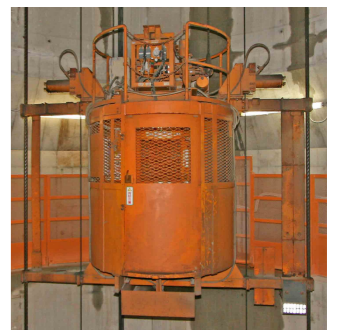
エレベータ(主立坑)

予約後であっても工事や現場の状況により入坑できなくなる場合がありますので、予めご了承ください。