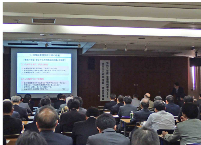
情報・意見交換会の会場

当日は、市民の皆様をはじめ、大学、研究機関、企業の研究者・技術者の皆様等、約120名の方々にご参加いただき、多くのご意見をいただきました。