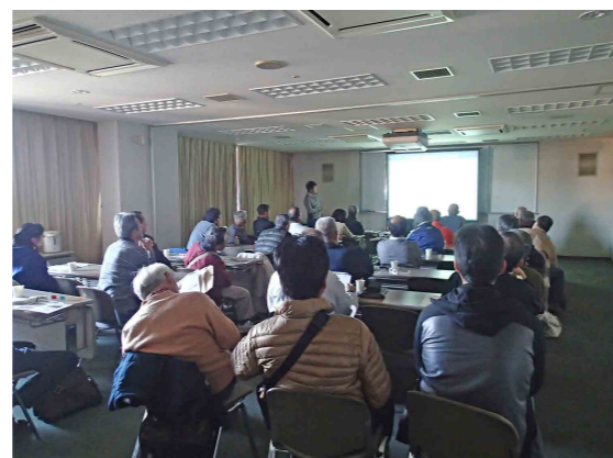
サイエンスカフェの様子

今回は、「地形と地層から読む大地の変化」をテーマとして、東濃地域を事例に、過去数万年から数百万年間の大地の変化を、気候変動や断層運動を読み解きながら、どのように現在の風景に至ったのかなどについて、ご説明いたしました。