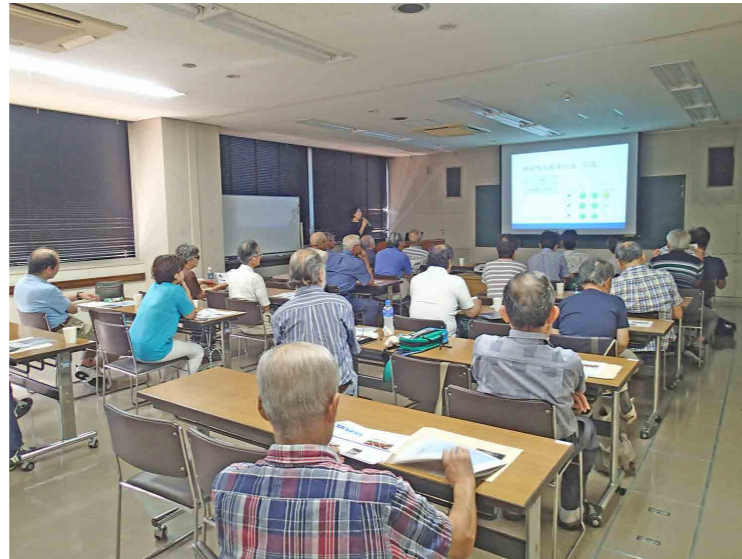
サイエンスカフェの様子

今回は、「炭素からわかるものの年代」をテーマとして、人の体や鉛筆、空気中の二酸化炭素など、様々なものに含まれている炭素を調べることによって年代を明らかにする方法を取り上げました。事例などを紹介しながら、和やかな雰囲気の中で進められました。