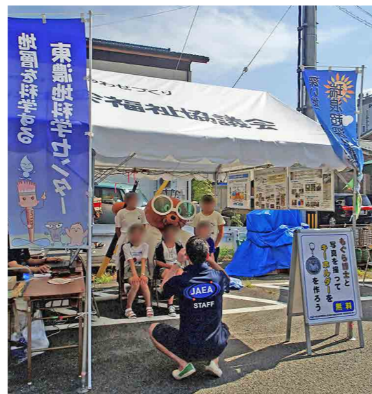
もぐら博士と記念撮影

東濃地科学センターのブースでは、パネルを用いた事業内容の説明やキャラクター（もぐら博士）と記念撮影した写真を用いたキーホルダーづくりを行い、多くの方々に来場していただきました。