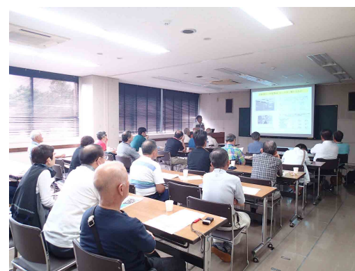
サイエンスカフェの様子

今回は、「ロックメカニクス」をテーマとして、物質の歪み具合や強度を評価する「力学」(メカニクス)とその応用である「岩盤力学」(ロックメカニクス)について、事例などを紹介しながら、楽しく和やかな雰囲気が進められました。