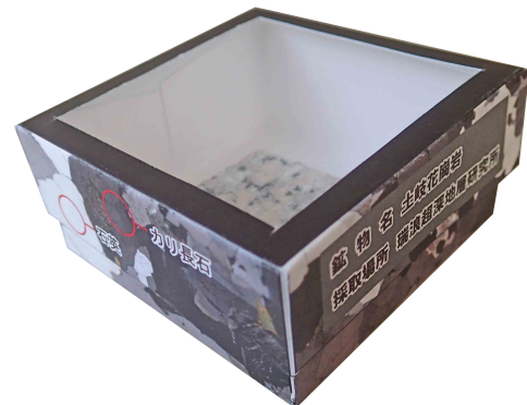
花崗岩(偏光顕微鏡で見た画像)がデザインされた標本箱

東濃地科学センターのブースでは、「花崗岩の標本箱を作ろう!」と題し、花崗岩(偏光顕微鏡で見た画像)をデザインした厚紙を、参加者がハサミとのりを使って標本箱を作りました。標本箱を作った後には、実際に研究坑道で掘削された花崗岩を標本箱に入れて観察を行いました。標本箱に入れた花崗岩は約7000万年前にマグマが地下でゆっくりと冷えて固まってできた岩石であることを説明したところ、参加者からは驚きの声が上がりました。