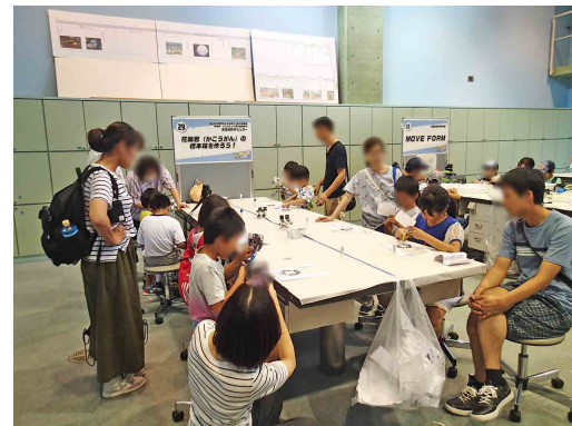
標本箱製作の様子