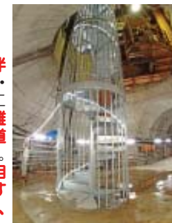
らせん階段 (約90段 ビル8階建相当)

工事現場での安全の確保のため、 小学生の方は4年生以上で保護者同伴 でお願いします。また入坑の際は、安全装備（つなぎ服・反射ベスト・ヘルメット・安全長靴・軍手・坑内 PHS など）を着用して頂きます。工事中の現場ですので、狭くて急な階段等もあります。 階段の昇降等が困難な方など自立歩行に支障のある方や高所、閉所恐怖症の方などは研究坑道に入坑できない場合がありますので、事前にご確認をお願いいたします。 なお、深度 500m の研究坑道の見学の際には、 約90段（ビル8階建相当の高さ）のらせん階段があり、昇降は体力的にも大きな負担となりますので、十分にご検討の上お申し込みください。 また、 飲酒されている方、妊娠中の方、体調がすぐれない方はご遠慮いただいております。 予約後であっても工事や現場の状況により入坑できなくなる場合がありますので、予めご了承下さい。