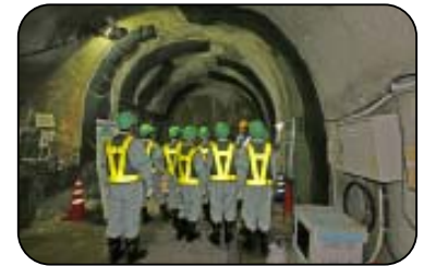
施設見学会 (深度300mステージ)

工事現場での安全の確保のため、小学生の方は4年生以上で保護者同伴をお願いします。また入坑の際は、安全装備 (つなぎ服・反射ベスト・ヘルメット・安全長靴・軍手・坑内 PHS など) を着用して頂きます。工事現場ですので、狭くて急な階段等もあります。階段の昇降等が困難な方など自立歩行に支障のある方や高所、閉所恐怖症の方などは研究坑道に入坑できない場合がありますので、事前にご確認をお願いいたします。