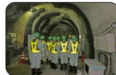
施設見学会(深度300mステージ)

工事現場での安全の確保のため、小学生の方は4年生以上で保護者同伴をお願いします。また入坑の際は、安全装備(つなぎ服・反射ベスト・ヘルメット・安全長靴・軍手・坑内PHSなど)を着用して頂きます。工事現場ですので、狭くて急な階段等もあります。階段の昇降等が困難な方など自立歩行に支障のある方や高所、閉所恐怖症の方などは研究坑道に入坑できない場合がありますので、事前にご確認をお願いいたします。