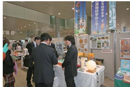
来場者に説明するビジネスコーディネーター

「き」業展への出展も11回目となり、地域の方々には、原子力機構が所有する特許や技術の活用など認知度も高まり、他の出展者からは機構の有する特許技術を調べて、連携を検討したいという声もいただきました。