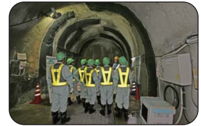
施設見学会（深度300mステージ）

工事現場での安全の確保のため、小学生の方は4年生以上で保護者同伴でお願いします。また入坑の際は、安全装備（つなぎ服・反射ベスト・ヘルメット・安全長靴・軍手・坑内 PHS など）を着用して頂きます。工事現場での現場ですので、狭くて急な階段等もあります。階段の昇降等が困難な方など自立歩行に支障のある方や高所、閉所恐怖症の方などは研究坑道に入坑できない場合がありますので、事前にご確認をお願いいたします。