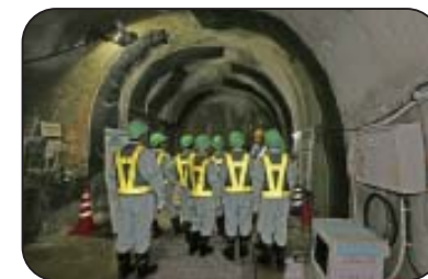
施設見学会（深度300mステージ）

工事現場での安全の確保のため、小学生の方は4年生以上で保護者同伴をお願いします。また入坑の際は、安全装備（つなぎ服・反射ベスト・ヘルメット・安全長靴・軍手・坑内 PHS など）を着用して頂きます。工事現場でのため、狭くて急な階段等もあります。階段の昇降等が困難な方など自立歩行に支障のある方や高所、閉所恐怖症の方などは研究坑道に入坑できない場合がありますので、事前にご確認をお願いいたします。