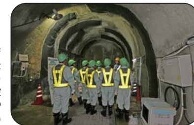
施設見学会(深度300mステージ)

工事現場での安全の確保のため、小学生の方は4年生以上で保護者同伴でお願いします。また入坑の際は、安全装備(つなぎ服・反射ベスト・ヘルメット・安全長靴・軍手・坑内 PHS など)を着用して頂きます。工事現場での現場ですので、狭くて急な階段等もあります。階段の昇降等が困難な方など自立歩行に支障のある方や高所、閉所恐怖症の方などは研究坑道に入坑できない場合がありますので、事前にご確認をお願いいたします。