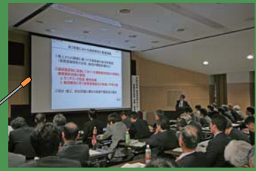
H24情報・意見交換会

情報・意見交換会は、東濃地科学センターが実施する地層科学研究を適正かつ効率的に行うため、主に大学、研究機関、企業の研究者・技術者の方を対象に研究開発の状況や成果について広く紹介し、情報・意見交換を行うことを目的として、一般の方にも参加可能なオープンな形式で毎年開催しています。