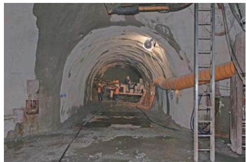
深度500m研究アクセス南坑道 (高さ3.5m、横幅4.5mのかまぼこ型)