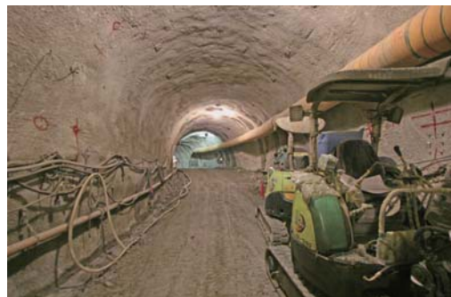
深度500m研究アクセス北坑道 (高さ4.5m、横幅5mのかまぼこ型)