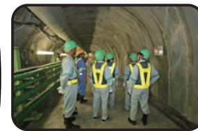
施設見学会（深度300m研究アクセス坑道）

工事現場での安全の確保のため、小学生の方は4年生以上で保護者同伴でお願いします。また入坑の際は、安全装備（つなぎ服・反射ベスト・ヘルメット・安全長靴・軍手・坑内PHSなど）を着用して頂きます。工事中の現場ですので、狭くて急な階段等もあります。階段の昇降等が困難な方など自立歩行に支障のある方や高所、閉所恐怖症の方などは研究坑道に入坑できない場合がありますので、事前にご確認をお願いいたします。