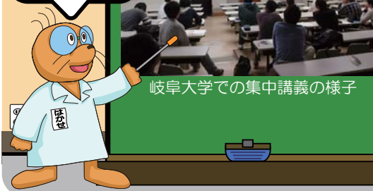
岐阜大学での集中講義の様子